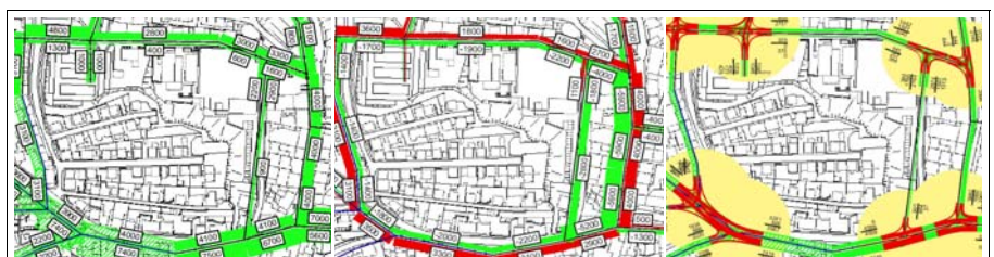
Verkehrsmo- und Variantenanalysen